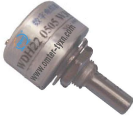
型号 WDH22 0505 W360